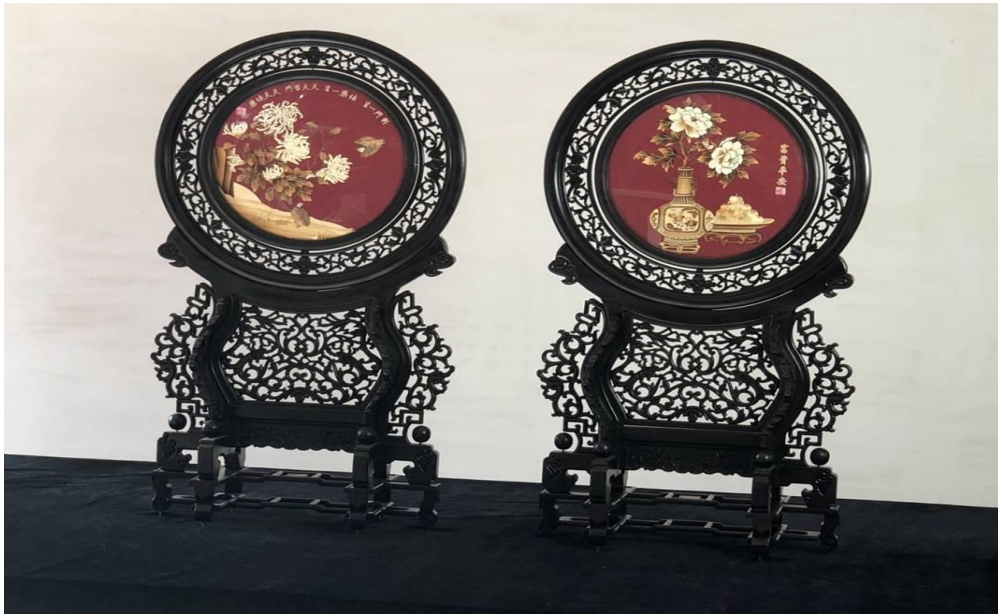
图 2-1 麦秆画座屏