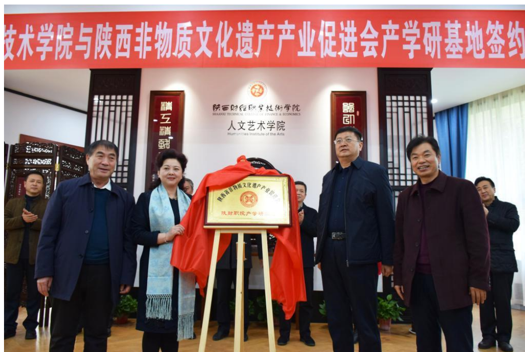
图 4-7 非遗促进会“产学研”基地揭牌仪式

1. 2019 年 12 月 11 日,陕西财经职业技术学院与陕西省非物质文化遗产产业促进会产学合作,在学院建成了非遗促进会“产学研”基地。