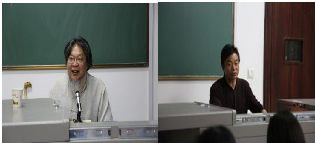
图 4-6 大师进课堂授课