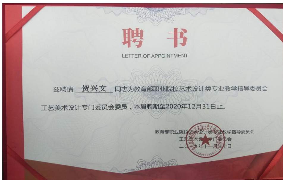
图 4-4 教育部艺术教指委聘书