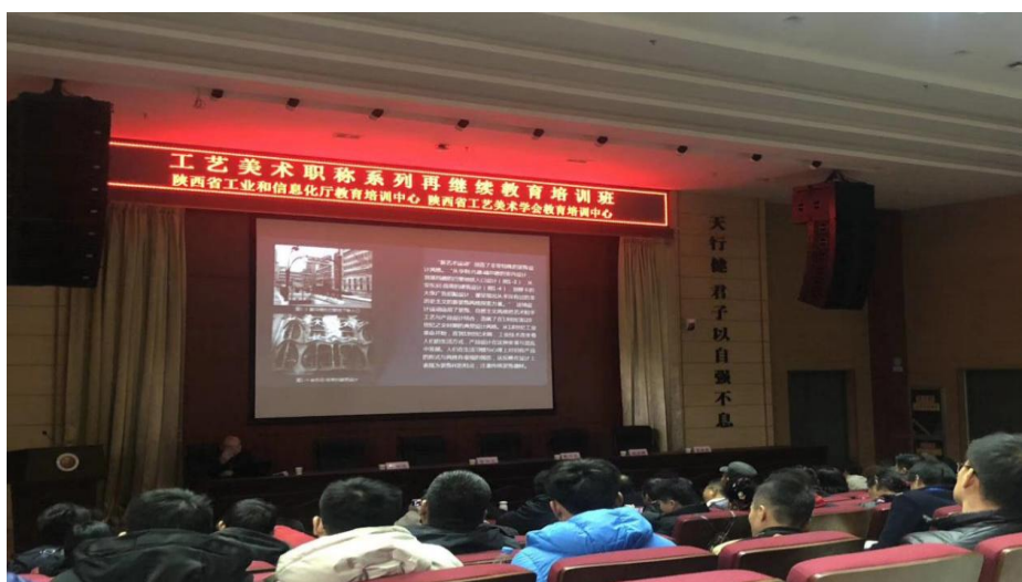
图 4-9 培训现场

1. 大师工作室于 2019 年 12 月 14 日至 12 月 15 日, 承担了由陕西省工业和信息化厅教育培训中心和陕西省工艺美术学会教育培训中心联合举办的工艺美术职称系列再继续教育培训、接待任务。此次培训为期 2 天, 全省 108 名工艺美术从业人员参加了培训。