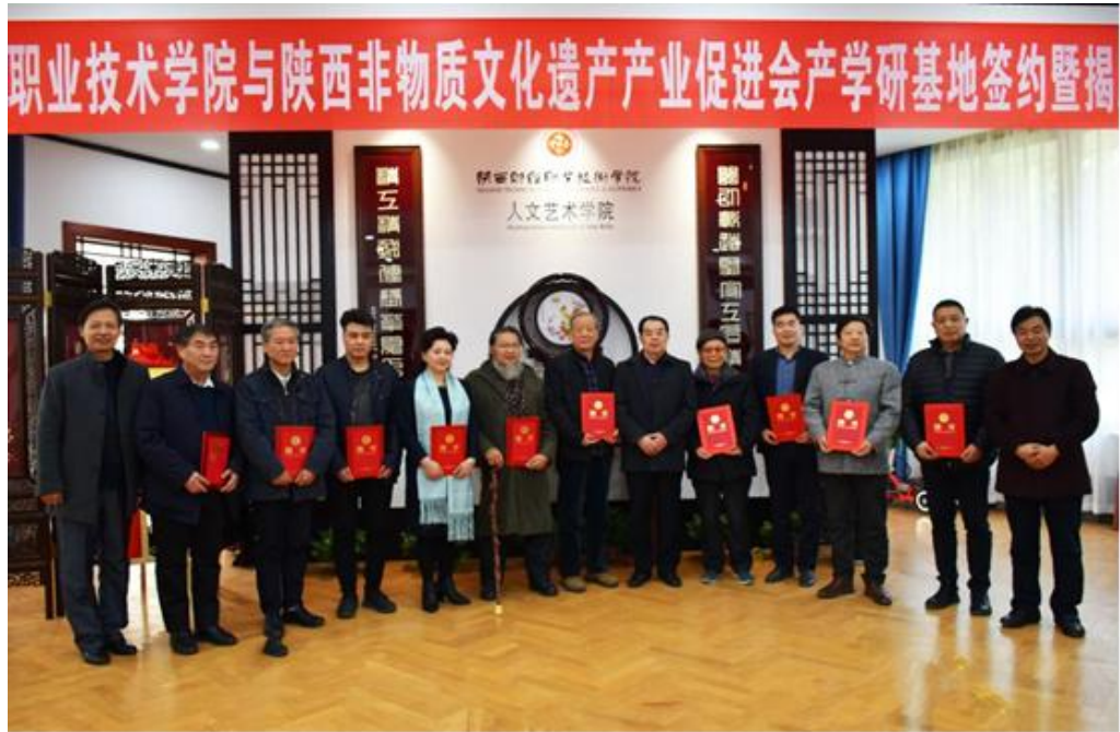
图 4-5 陕西财经职业技术学院聘任国大师、省大师被聘任为学院客座教授