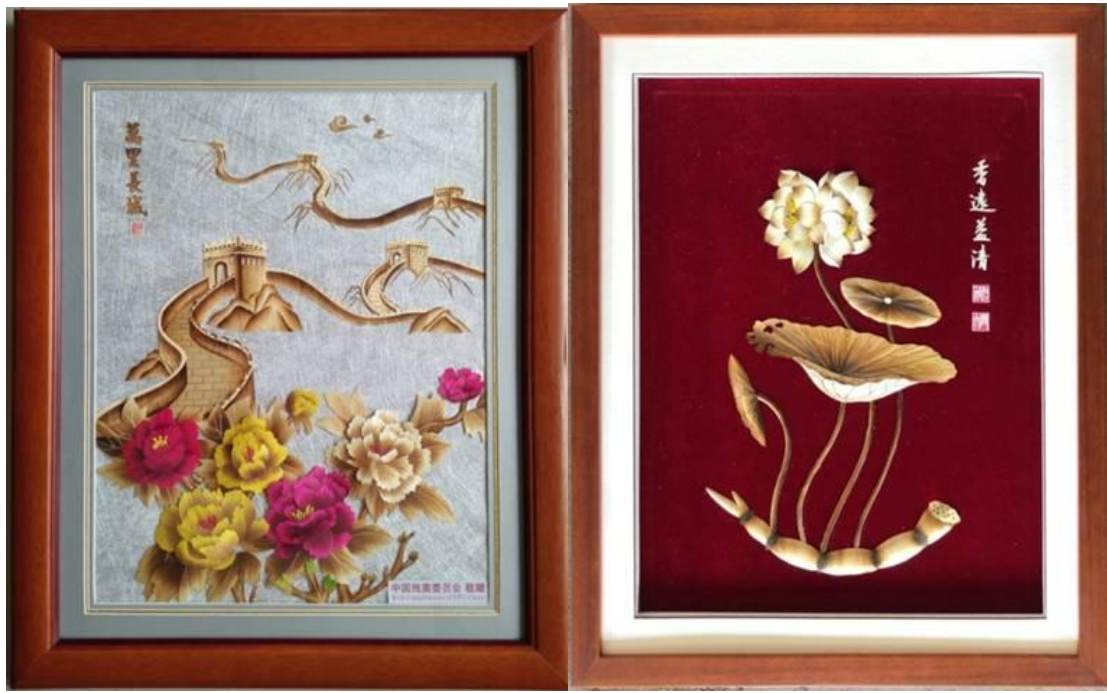
图 2-3 为参加巴西里约残奥会的中国残奥委员会制作国礼及运动员随手礼