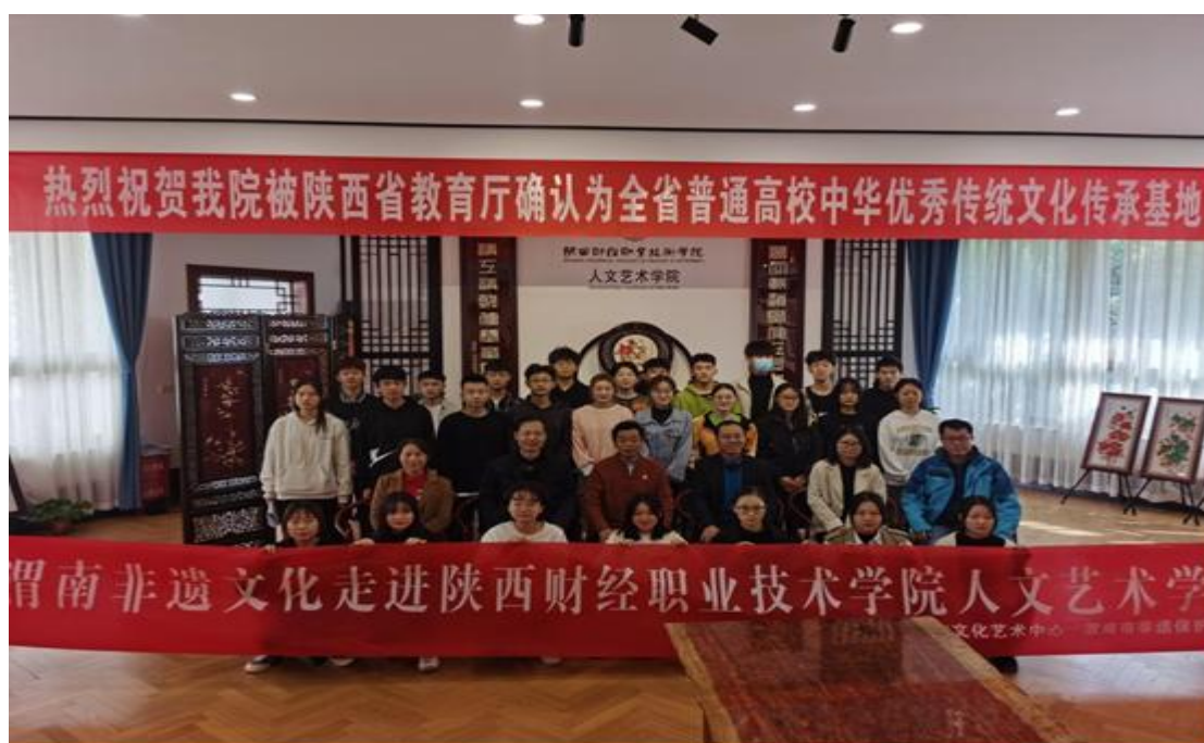
图 4-9 非遗文化进校园活动留影