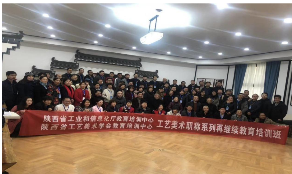
图 4-10 参训人员合影