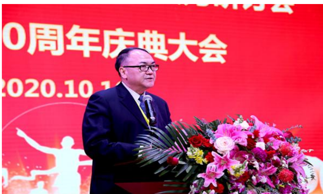
图 4-5 中国工艺美术协会会长周郑生在校庆 60 庆典致辞

4. 中国工艺美术协会会长、国务院参事室中央文史研究馆特约研究员周郑生在校庆 60 庆典致辞中为学院大力弘扬中华优秀传统文化、开展非遗进校园、大师进课堂等做法点赞，希望学院不忘教育初心、牢记育人使命，坚持社会主义办学方向，将中华优秀传统文化进校园做实做细，大力培育和弘扬社会主义核心价值观，加强“五育”教育，培育和传承好工匠精神，提高人才培养质量。