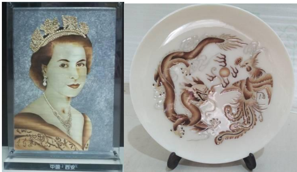
图 2-4 为在英国爱丁堡举办的康复国际世界大会一百多个国家制作国礼 并赠送给英国公主安妮