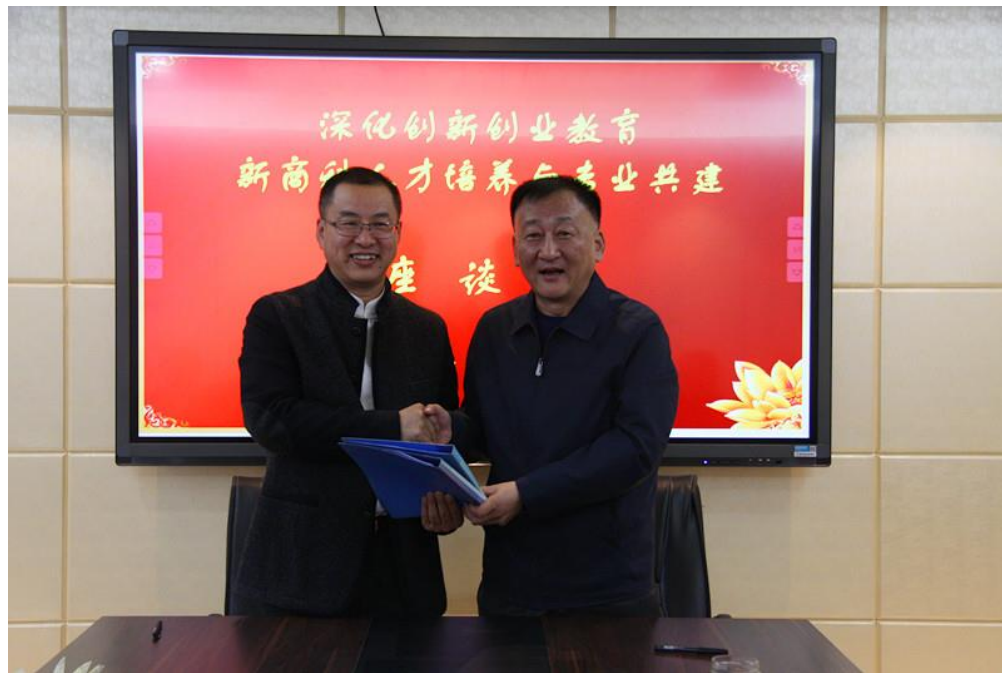
双方就“深化创新创业教育，产教融合协同育人”达成共识