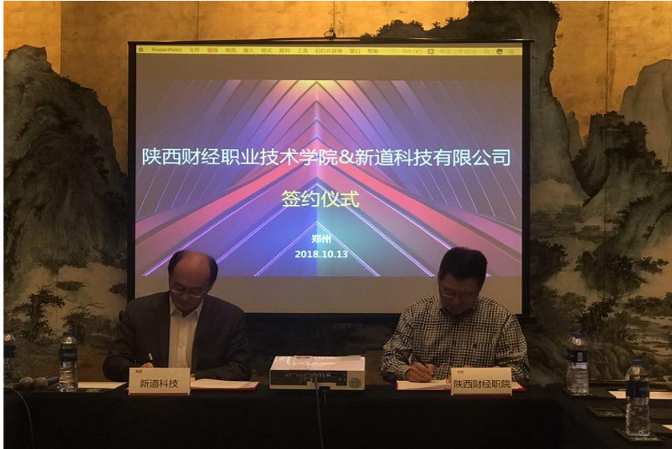
双方签订产教融合与协同育人合作协议