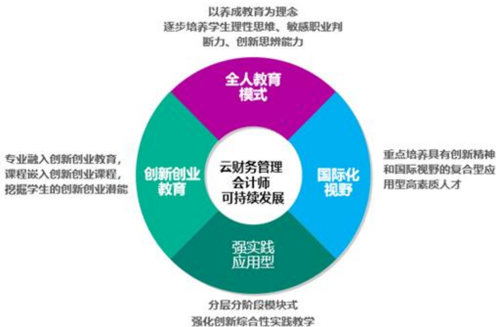
职业云财务管理会计师人才培养理念