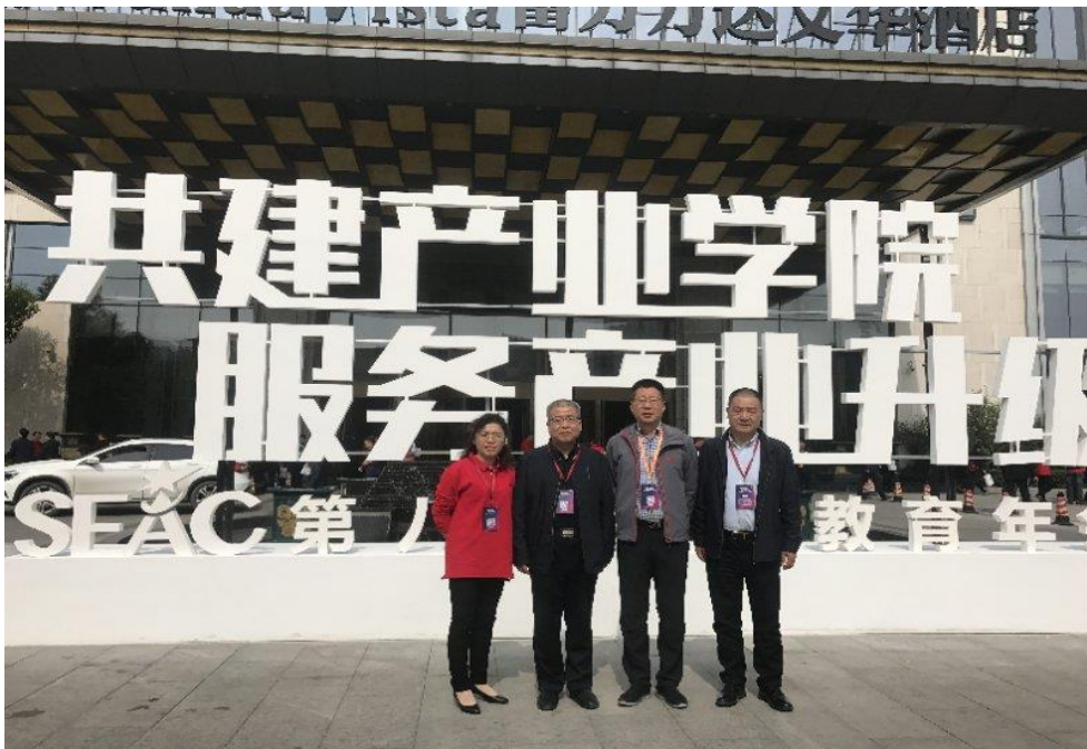
我院参加第八届新道教育年会