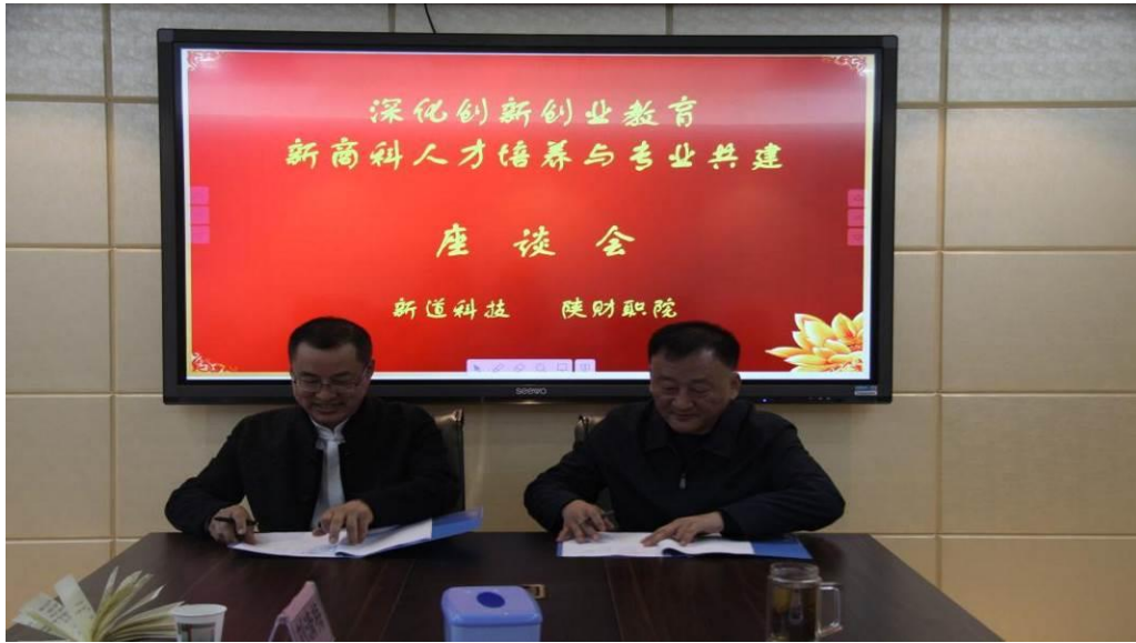
双方签订成立新道科技会计学院框架协议