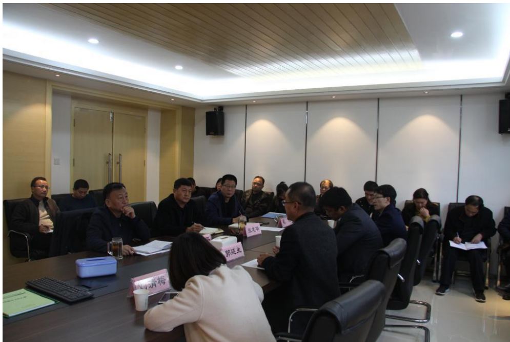
学院有关部门负责人、系部教研室主任、骨干教师等 20 余人参加座谈